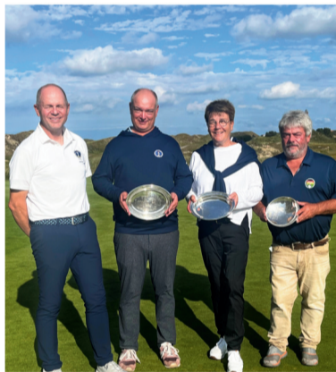
Von frostigem Saisonstart bis spätsommerlichem Turnierfinale: 2025 zeigte sich der Platz wie gewohnt facettenreich.

Der Winter konnte in diesem Jahr auch bei uns für ein paar Tage frostig sein, mit Tiefstwerten bis rund minus 4,7 Grad im Februar.