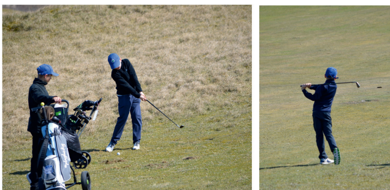
Übung macht den Meister: die Kids und Jugendlichen aus dem Bergischen Land waren mit Ehrgeiz und jeder Menge Spaß bei der Sache

Früh aufstehen hieß es für die jungen Golfer des Golfclubs Bergisch Land zum Beginn der Osterferien – bereits um 8.10 Uhr legte das Schiff am Samstag, den 12. April, in Norddeich ab. Kaum auf Norderney angekommen, stand die Gruppe, ausgestattet mit Schlägern und viel Vorfreude, um 10 Uhr schon am ersten Abschlag. So begann ein sechstägiges Golfferien-Camp auf der Insel Norderney.