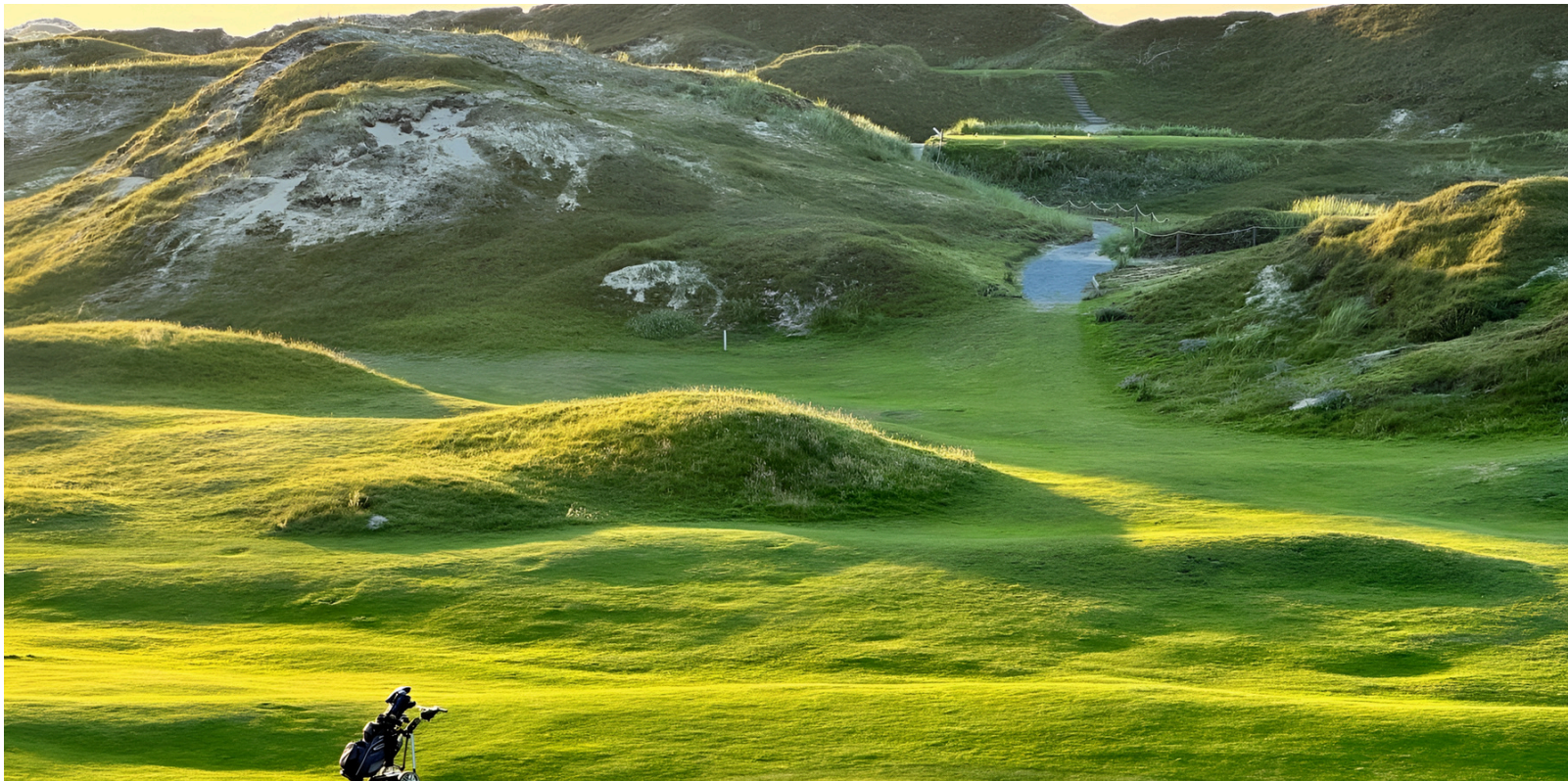
Eine besondere Stimmung auf dem Platz: Loch 5 in der Abendsonne