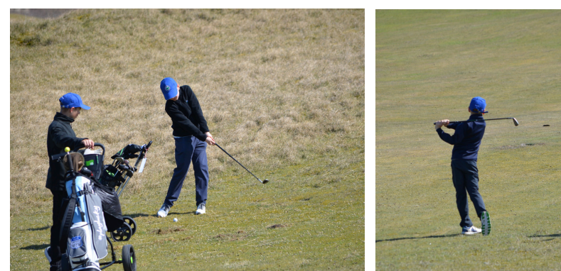
Übung macht den Meister: die Kids und Jugendlichen aus dem Bergischen Land waren mit Ehrgeiz und jeder Menge Spaß bei der Sache

Früh aufstehen hieß es für die jungen Golfer des Golfclubs Bergisch Land zum Beginn der Osterferien – bereits um 8.10 Uhr legte das Schiff am Samstag, den 12. April, in Norddeich ab. Kaum auf Norderney angekommen, stand die Gruppe, ausgestattet mit Schlägern und viel Vorfreude, um 10 Uhr schon am ersten Abschlag. So begann ein sechstägiges Golfferien-Camp auf der Insel Norderney.